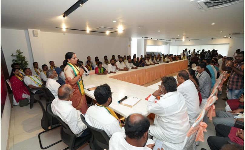
జయశంకర్ సార్ సహా తెలంగాణ అమరవీరుల విగ్రహాలు పెట్టాలని కవిత డిమాండ్ చేశారు.