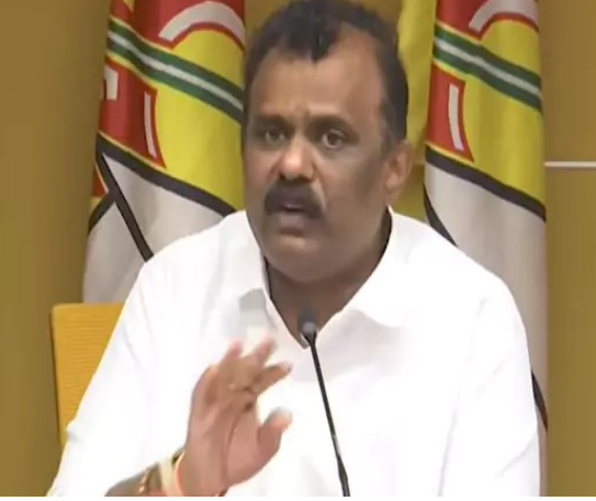
నెట్లూని చూస్తున్నారని మండిపడ్డారు. రాష్ట్రంలో శాంతి భద్రతలకు భంగం కలిగించేందుకు వైకాపా కుట్రలు చేస్తోందన్నారు.

మంగళగిరి, ఇది కడ నిజం :: ఇకనైనా కుట్రలను వైకాపా వీడాలి