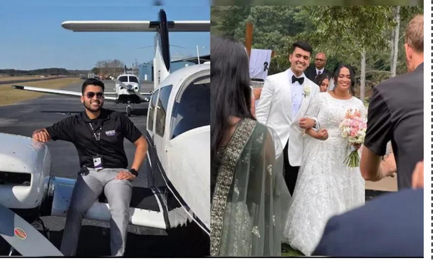
విమానం కూలినట్లు గుర్తించామన్నారు.

ప్రమాదం జరిగిందని కుటుంబసభ్యులు తెలిపారు. దవే తల్లితండ్రులు కేరళలోని ఎర్నాకుళం జిల్లా నుంచి అమెరికాకు వలసవెళ్లారు. కుమారుడి మరణం ఘటనతో ఆ పెరెంట్స్ విలపిస్తున్నారు. వాస్తవానికి పెళ్లి వేడుక ముగిసే వరకు రాత్రి 9 గంటలకి, ఆ సమయంలో వర్షం కురుస్తోందని, పొగ మంచు కూడా ఎక్కువగా ఉన్నట్లు దవే తండ్రి జాగ్రత్త తీసుకున్నారు. ఇలాంటి వాతావరణంలో గగన ప్రయాణం ఇబ్బందికరమే అని తన కుమారుడు కూడా ఆందోళన వ్యక్తం చేశాడని తండ్రి జాగ్రత్త గుర్తు చేశారు. అయితే హయ్యర్ అల్టిట్యూడ్ లో కొత్త ఘంటసూ తీసుకెళ్తానని హెలికాప్టర్ ఫైలట్ చెప్పడంతో ప్రయాణం జరిగిందని, కానీ దాన్ న విల్లే వద్ద ఉన్న కొండల్లో ఆ