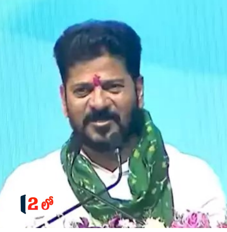
2లో: చేస్తాం. కొత్తగా మరో రెండున్నర లక్షల ఇందిరమ్మ ఇళ్లను ఈ వేదిక నుంచే మంజూరు చేస్తున్నట్లు ప్రకటిస్తున్నా.

కాగజ్ నగర్, ఇది కద నిజం: ఆదిలాబాద్ ప్రాంత అభివృద్ధి కోసం నిరంతరం కృషి చేస్తానని తెలంగాణ సీఎం రేవంత్ రెడ్డి చెప్పారు. ఆదిలాబాద్ ఆదివాసీల సొంతింటి కల నెరవేరాలని ప్రతి నియోజకవర్గానికి 3,500 ఇళ్ల చొప్పున పేదలకు మంజూరు చేయాలని నిర్ణయం తీసుకున్నామని చెప్పారు. కాగజ్ నగర్ లో పర్యటించిన సీఎం.. పలు అభివృద్ధి పనులను ప్రారంభించారు. అంతరంగ బహిరంగ సభలో మాట్లాడారు. "తండాలు, గూడేలో ఉండే అర్జులైన ఆదివాసీ బిడ్డల కోసం స్పెషల్ డ్రైవ్ నిర్వహించి నూరు శాతం ఇందిరమ్మ ఇళ్లు ఇవ్వాలి. గుడిసెలు తేని ఆదిలాబాద్ జిల్లాను నేను చూడాలనుకుంటున్నా. రాష్ట్రంలో సెప్టెంబర్ 17న మరో లక్ష గృహప్రవేశాలు