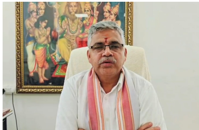
ఇది కద నిజం: యాదాద్రి భువనగిరి జిల్లాలోని ప్రముఖ పుణ్యక్షేత్రమైన యాదగిరిగుట్టలో ఈనెల 23వ తేదీన