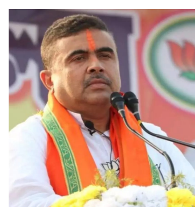
మొదటి పేజీ తరువాయి అధిష్టానం కనరత్తు.. సువేందుకే మొగ్గు

రాష్ట్రంలో అధికారం దక్కించుకున్న తర్వాత ముఖ్యమంత్రి పీఠం ఎవరికి దక్కుతుందనే అంశంపై బీజేపీ అగ్రనాయకత్వం సుదీర్ఘంగా చర్చించింది. పలువురు సీనియర్ నేతల పేర్లు పరిశీలనకు వచ్చినప్పటికీ, క్షేత్రస్థాయిలో బలమైన పట్టును సువేందు అధికారి వైపే అధిష్టానం మొగ్గు చూపింది. పార్టీ కేంద్ర పరిశీలకుల సమక్షంలో జరిగిన సమావేశంలో ఎమ్మెల్యేలందరూ సువేందు నాయకత్వానికి ఏకగ్రీవంగా మద్దతు తెలిపారు. దీంతో బెంగాల్ తొలి బీజేపీ ముఖ్యమంత్రిగా ఆయన చరిత్ర సృష్టించబోతున్నారు.