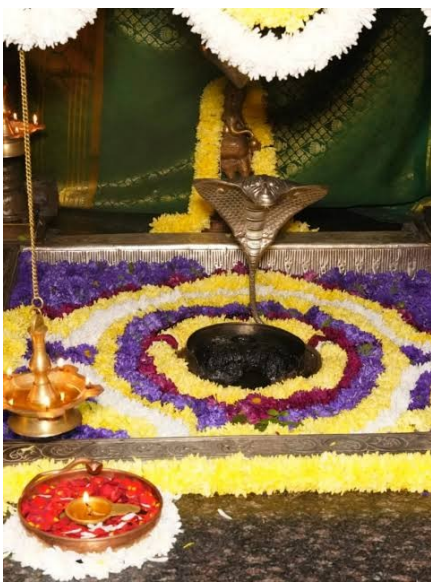
కడపజిల్లా (ఇది కద నిజం) మార్చి 31 :ప్రాద్దుటూరు, కళ్యాణం కోసం ఆఖండ దీపస్థాపన చేశారు.కలక

రామేశ్వరం లో ఆధ్యాత్మిక శోభతో విరాజిల్లుతున్న ప్రాద్దుటూరు నియోజకవర్గంలోని పవిత్ర పుణ్యక్షేత్రం రామేశ్వరం నేడు శివరామస్మరణతో మారుమోగింది. పరమశివుని భక్తుల ఆధార్యదైవం, ముక్తి ప్రదాత అయిన శ్రీ ముక్తి రామలింగేశ్వర స్వామి వారి ఉత్సవాలు మంగళవారం అత్యంత వైభవంగా ప్రారంభమయ్యాయి.. ఆలయ ప్రాంగణమంతా తోరణాలు, పుష్ప అలంకరణలతో శోభాయమానంగా ముస్తాబై భక్తులకు కైలాసాన్ని తలపిస్తోంది. ఉదయం శాస్త్రోక్తంగా ప్రారంభమైన క్రతువులనేడు ఉదయం 10 గంటల శుభ ముహూర్తాన వేద పండితుల మంత్రోచ్ఛారణల నడుమ ఉత్సవాలకు అంకురార్పణ జరిగింది. ఈ సందర్భంగా ఆలయంలో ఈ క్రింది ప్రధాన క్రతువులను శాస్త్రోక్తంగా నిర్వహించారు. స్వామివారి అనుజ్ఞ, ప్రదక్షిణ, ఉత్సవాలు, నిర్వహించారు సాగాలని కోరుతూ స్వామివారి అనుమతి తీసుకుని ఆలయ ప్రదక్షిణ చేశారు. హోమగుండాల నడుమ యాగశాల ప్రవేశం నిర్వహించి, విష్ణుశ్శర్ పూజతో కార్యక్రమాలను మొదలుపెట్టారు. శుద్ధి కార్యక్రమాలు, శైవశుద్ధి, పుణ్యాహవాచనం మరియు పంచగవ్య ప్రాశనంతో ఆలయ పరిసరాలను పవిత్రం చేశారు. దీక్షాధారణ, అర్చక స్వాములు, భక్తులు భక్తిశ్రద్ధలతో దీక్షాధారణ గావించి, లోక స్వాములు, భక్తులు భక్తిశ్రద్ధలతో దీక్షాధారణ గావించి, లోక