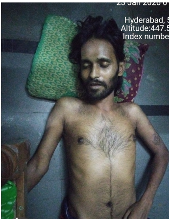
Hyderabad, 5 Altitude: 447.5 Index number